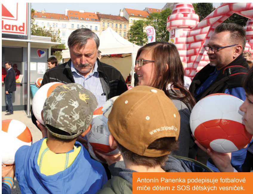
Antonín Panenka podepisuje fotbalové míče dětem z SOS dětských vesniček.

NA KONCI DUBNA SE NA STADIONU FK VIKTORIE ŽIŽKOV V PRAZE USKUTEČNILO NETRADIČNÍ MEZINÁRODNÍ FOTBALOVÉ UTKÁNÍ. V BENEFIČNÍM UTKÁNÍ PRO DĚTI Z SOS DĚTSKÝCH VESNIČEK SE STŘETL „DOMÁCÍ“ TÝM KAUFLAND ČESKÁ REPUBLIKA S RAKOUSKÝM FOTBALOVÝM KLUBEM GSC LIEBENFELS. UTKÁNÍ SKONČILO VÍTĚZSTVÍM 5:3 PRO ČESKÝ TÝM A VÝTĚŽKEM TĚMĚŘ 170 000 Kč PRO SOS DĚTSKÉ VESNIČKY.