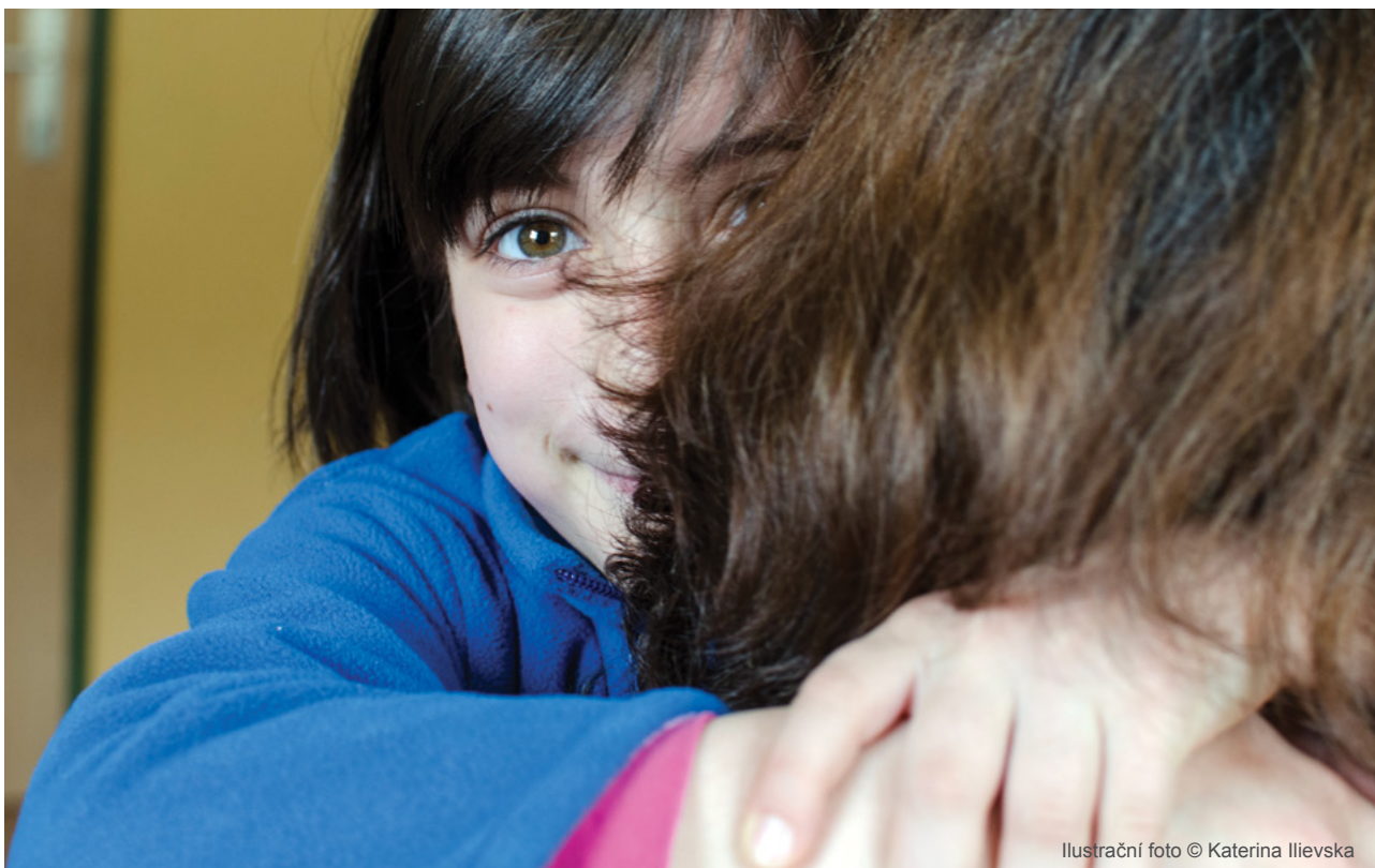
Ilustrační foto © Katerina Ilievská