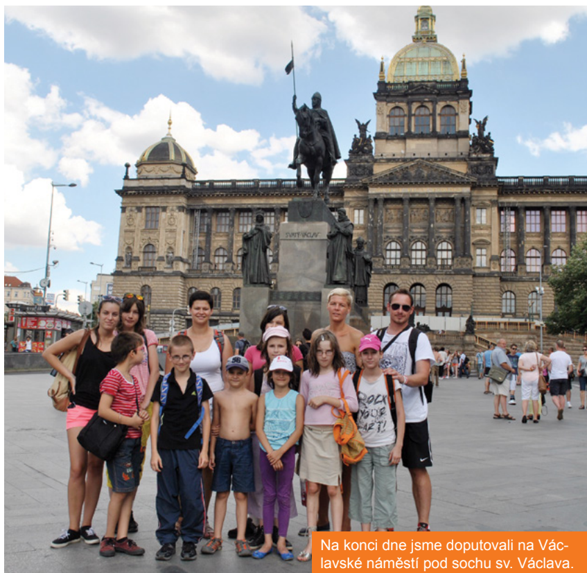
Na konci dne jsme doputovali na Václavské náměstí pod sochu sv. Václava.

Naše první kroky směřují k podzemní dráze a některé děti nechápavě zírají, kde to vlastně jsou. Projížďka metrem je pro ně prvním velkým zážitkem. Po dlouhých