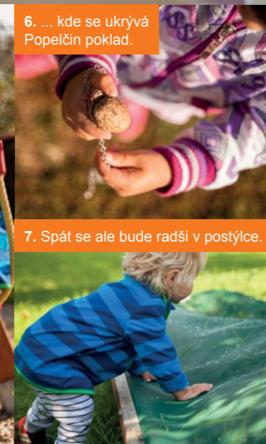
6. ... kde se ukrývá Popelčin poklad.