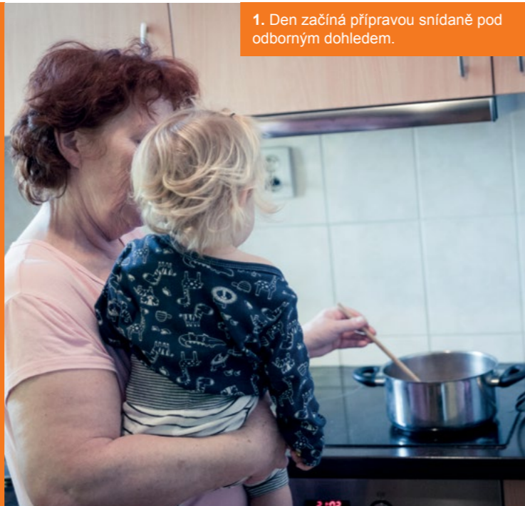
1. Den začíná přípravou snídaně pod odborným dohledem.

ÚKOLEM NAŠICH KRIZOVÝCH ZAŘÍZENÍ JE POSKYTNOUT DOČASNÉ ÚTOČIŠTĚ DĚTEM, KTERÉ VYŽADUJÍ OKAMŽITOU POMOC. SNAŽÍME SE PROTO VYTVOŘIT PRO NĚ PODMÍNKY BLÍŽÍCÍ SE RODINNÉMU PROSTŘEDÍ, VE KTERÝCH SE BUDOU CÍTIT JAKO DOMA. PODÍVEJTE SE, JAK VYPADÁ JEJICH BĚŽNÝ DEN.