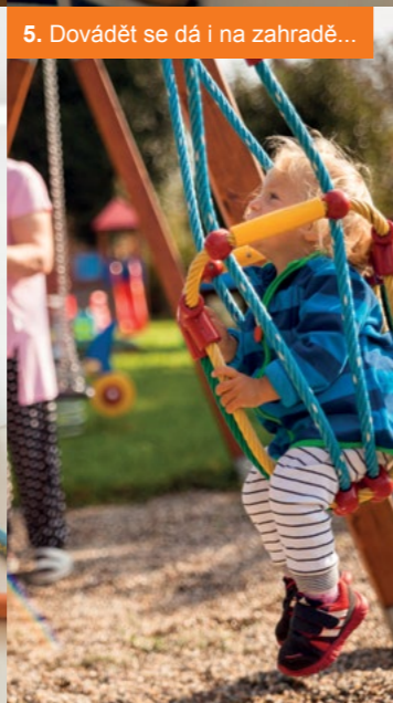
5. Dovádět se dá i na zahradě...