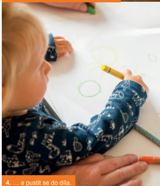
4. ... a pustit se do díla.