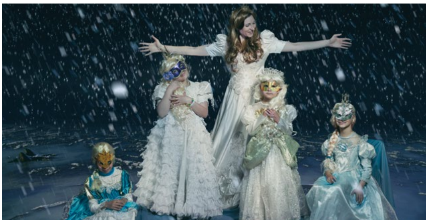
Děti z karlovarské SOS dětské vesničky zachytil svým fotoaparátem Herbert Slavík

ZNÁMÝ ČESKÝ FOTOGRAF HERBERT SLAVÍK V KVĚTNU LETOŠNÍHO ROKU NAFOTIL SÉRII FOTOGRAFIÍ DĚTÍ Z KARLOVARSKÉ SOS DĚTSKÉ VESNIČKY. TYTO FOTOGRAFIE BYLY ZVEŘEJNĚNY NA VERNISÁŽI V NÁRODNÍM DIVADLE A POTÉ BYLY VYDRAŽENY. Z FOTOGRAFIÍ NAVÍC PŘIPRAVÍME KALENDÁŘ V LIMITOVANÉ EDICI 100 KUSŮ, KTERÝ BUDE MOŽNO ZAKOUPIT NA WWW.SOS-VESNICKY.CZ/ESHOP .