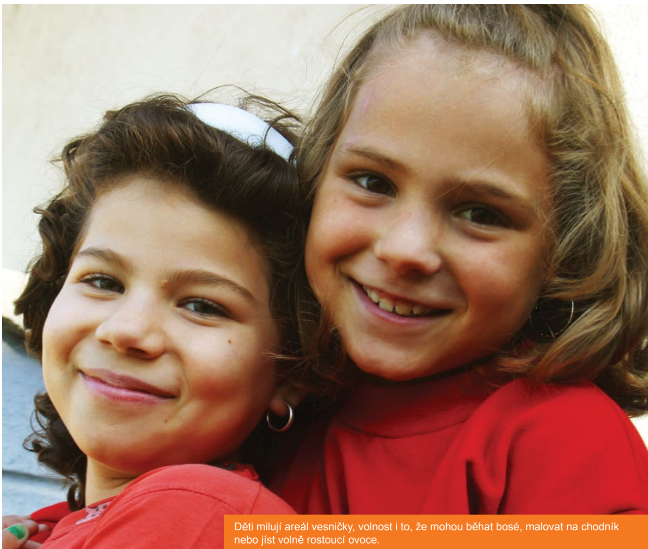
Děti milují areál vesničky, volnost i to, že mohou běhat bosé, malovat na chodník nebo jíst volně rostoucí ovoce.

„Zajímá vás, jak probíhá náš den?“ ptá se pan Novák. „Náš den začíná už o den dříve tak, že si večer připravíme hromádky s oblečením. Ráno vstávám v šest a oblékám děti, které rozvezu do školy a školky, potom do práce. Po škole jsou děti v družině a na zájmových kroužcích. Okolo 16:30 je vyzvedávám a jedeme domů. Potom chvilka volna, aby se děti proběhly venku,“ popisuje pyšný otec. „Děti milují areál vesničky, volnost i to, že mohou běhat bosé, malovat na chodník nebo jíst ovoce, volně rostoucí ve vesničce. Po večeri koupání a zase ty hromádky na další den. Ve vesničce jsme maximálně šťastní. Bez pomoci SOS dětských vesniček by všechno takto klidné a úspěšné nebylo,“ přiznává pan Novák.