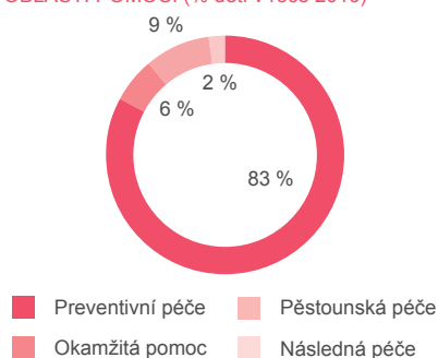
OBLASTI POMOCI (% dětí v roce 2016)