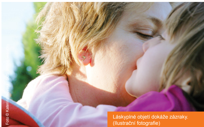
Láskyplné objetí dokáže zázraky. (Ilustrační fotografie)